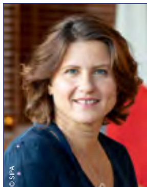
Roxana Maracineanu Ministre des Sports

Le sport est à la fois un enjeu et un symbole. Un enjeu de santé, de bien-être, d'éducation, de cohésion sociale mais aussi un symbole de liberté.